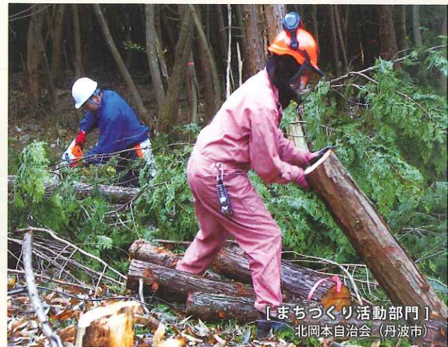
【まちづくり活動部門】 北岡本自治会（丹波市）