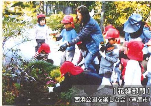
【花緑部門】 西浜公園を楽しむ会（芦屋市）