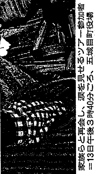
家族らと再会し、涙を見せるツアー参加者。13日午後3時40分ごろ、五城目町役場

の健康相談を行うことを検討している。また「岩手県の皆さんの対応に感謝したい」として、今後、大槌町に物資や義援金を贈ることも検討する。 北都トラベルによると、一行の旅行は15年ほど前から企画しており、五城目、井川町の老人クラブの会員が主なメンバー。毎年1〜2回、県内や岩手、青森、山形など平日程度でバスで移動できる温泉地に旅行しているという。