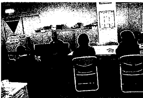
県老連事務局職員