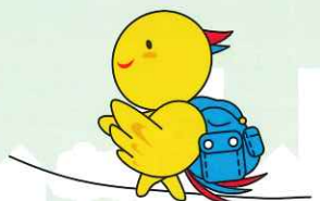
防災マスコットはばタン

阪神・淡路大震災から復興した街並みや震災モニュメントを巡り、防災意識を新たにしながら、緊急時の避難路・救援路を歩いてみませんか。