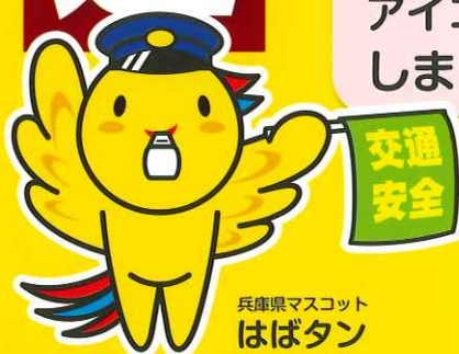
兵庫県マスコット はばタン

信号機のない横断歩道では、歩行者・ドライバーの両方が手を挙げるとともに、目でアイズ(アイコンタクト)などを行うことによって、交通事故の防止を図る運動です。