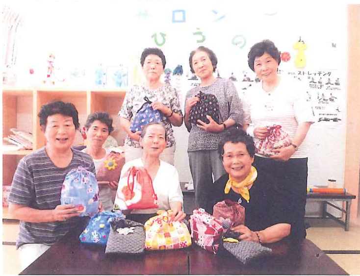
福島県広野町老人クラブ連合会