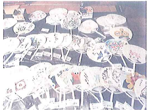
7月23日 いわき市銭田仮設住宅（楡葉町から避難されている方々です）