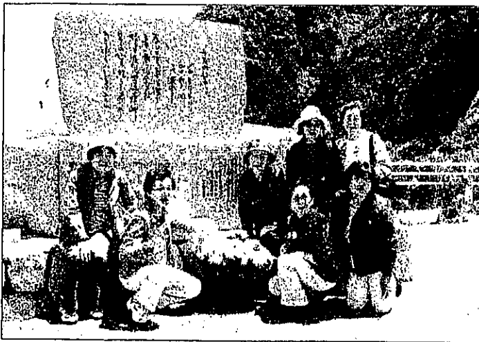
奇跡的に残った「みだれ髪」の歌碑の前にて