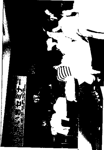
▲豊中市で開催された「元気回復ふれあい虹づくりフェスタ」には約750名が参加した