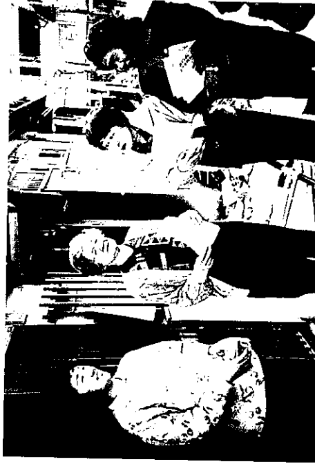
西宮市のシルバーボランティア団体「うづき会」は震災直後から積極的に救援活動に取り組んだ

大阪府老連は、平成7年6月28日に西宮市老連を訪問し、隣接の老人クラブとしての今後の協力・交流を申し出るとともに、被災地を慰問、被災状況の把握に努めた。震災の混乱が一段落した11月24日には西宮市老連を招き、激励交流会を開催。震災物故者法要や文楽鑑賞の実施、震災体験を聞くなどの交流活動を行った。さらに、平成8年5月9日、交流懇談会を実施。この会では西宮市老連会員の民踊、歌唱披露などもみられ、被災の影響が薄らいできていることを参加者実感させた。