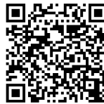
(横断歩道合図 (アイズ) 運動)